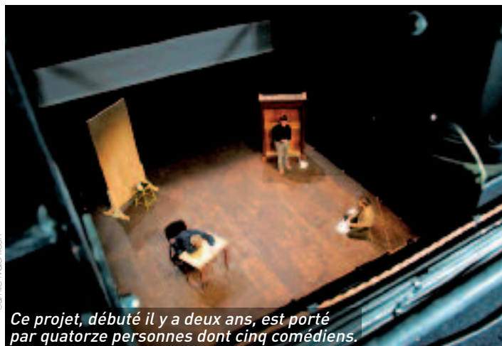
Ce projet, débuté il y a deux ans, est porté par quatorze personnes dont cinq comédiens.