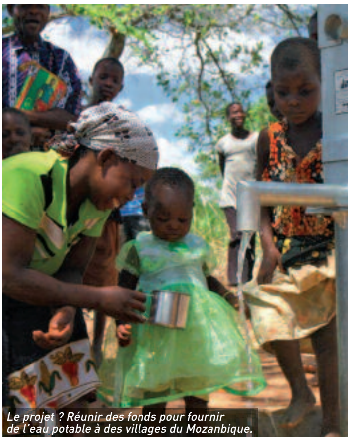
Le projet ? Réunir des fonds pour fournir de l'eau potable à des villages du Mozambique.

Amiens Gospel Challenge Répétitions les jeudis, de 20h à 22h, pendant dix semaines (hors vacances scolaires) À partir du 15 mars, dans l'église Saint-Pierre Frais de participation : 5 € par séance Concert samedi 2 juin (lieu indéterminé)