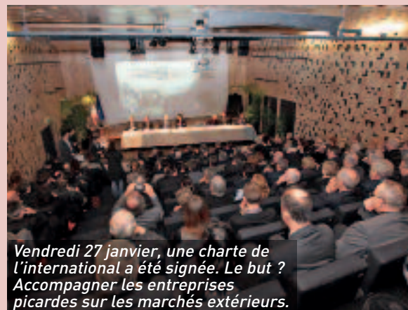
Vendredi 27 janvier, une charte de l'international a été signée. Le but ? Accompagner les entreprises picardes sur les marchés extérieurs.

L'inauguration du nouvel hôtel consulaire a été l'occasion de la signature de la charte de l'international en Picardie en présence de Pierre Lelouche, secrétaire d'État au commerce extérieur. À travers ce document, l'ensemble des signataires (État, Conseil régional, CCIR, UbiFrance, Coface, Oséo, Conseillers pour commerce extérieur de la France) s'engagent à accompagner les entreprises picardes sur les marchés extérieurs, et plus particulièrement les primo-exportateurs. Le nouvel hôtel consulaire comptera un étage dédié à l'international. Les différents acteurs du soutien à l'export en Picardie y seront réunis constituant ainsi une "maison de l'international".