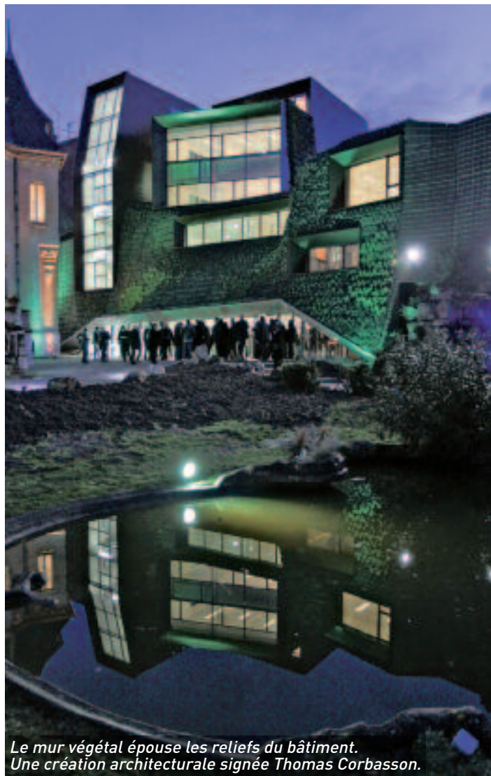
Le mur végétal épouse les reliefs du bâtiment. Une création architecturale signée Thomas Corbasson.