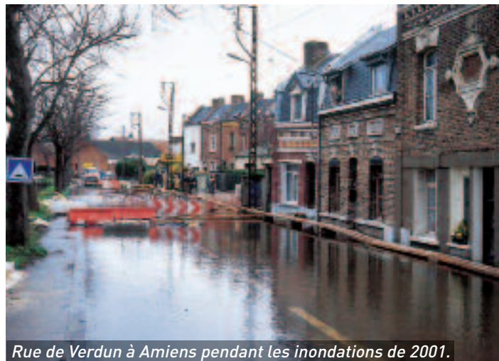
Rue de Verdun à Amiens pendant les inondations de 2001.

Votre maison est-elle située en zone inondable ? Connaissez-vous toutes les contraintes d'urbanisme réglementaires ? Jusqu'au 16 février, une enquête publique préalable à l'approbation du Plan de prévention des risques naturels prévisibles "inondations" est ouverte. Quinze communes d'Amiens Métropole situées dans le bassin versant de la Somme sont concernées : Amiens, Blangy-Tronville, Boves, Cagny, Camon, Dreuil-lès-Amiens, Glisy, Longueau, Pont-de-Metz, Rivery, Remiencourt, Saleux, Salouël, Thézy-Glimont et Vers-sur-Selle. Projet réglementaire, notice explicative, cartes des zones à risques et des enjeux, etc. Les documents sont consul-