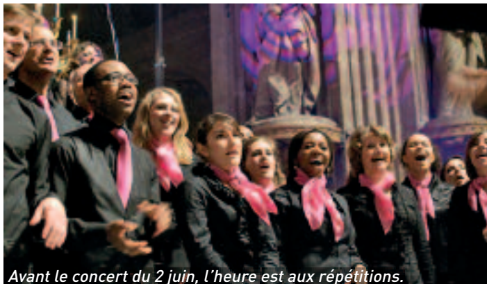
Avant le concert du 2 juin, l'heure est aux répétitions.