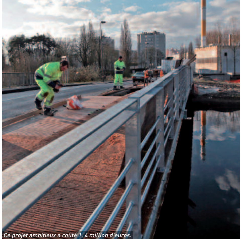
Ce projet ambitieux a coûté 1,4 million d'euros.

Trois passerelles relieront bientôt Étouvie au parc du Grand Marais. Le chantier a nécessité de nombreuses études d'ingénierie depuis la pose de la première pierre le 23 juin dernier. Les travaux sont désormais bien visibles.