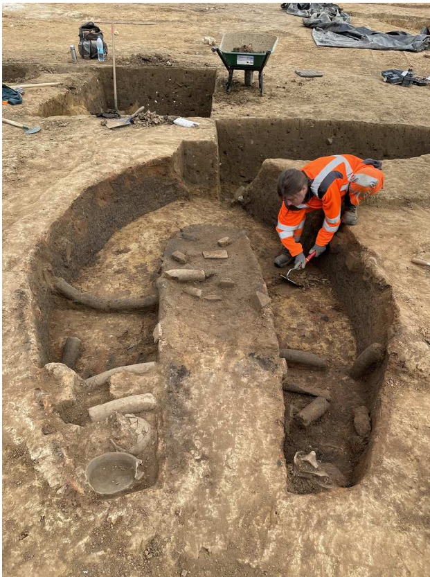
Thérouanne / Saint-Augustin (Pas-de-Calais)

Entrée libre dans la limite des places disponibles et selon les normes sanitaires en vigueur