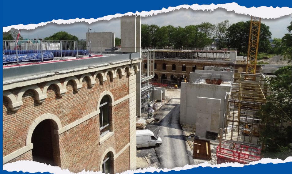
La Citadelle d'Amiens lors des travaux d'aménagement, photographie, 2015, [31F164, Archives municipales d'Amiens]