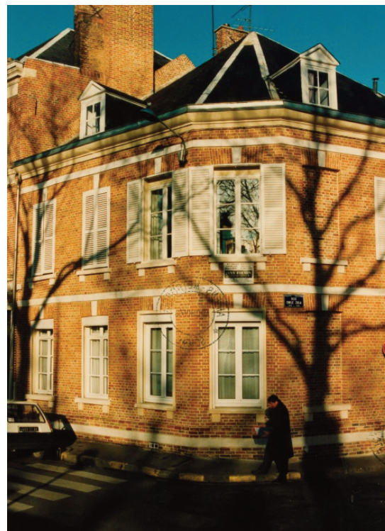
A : Construction de logements Vallée Saint-Ladre à Amiens, photographie, 23 novembre 1976, [6Fi780, Archives municipales d'Amiens]