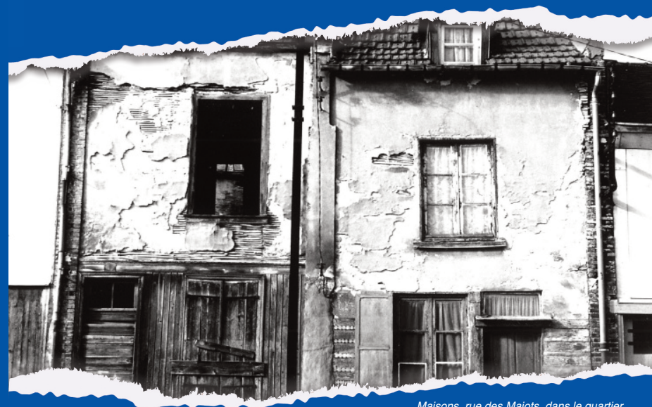
Maisons rue des Majots, dans le quartier Saint-Leu à Amiens, photographie, 1978.