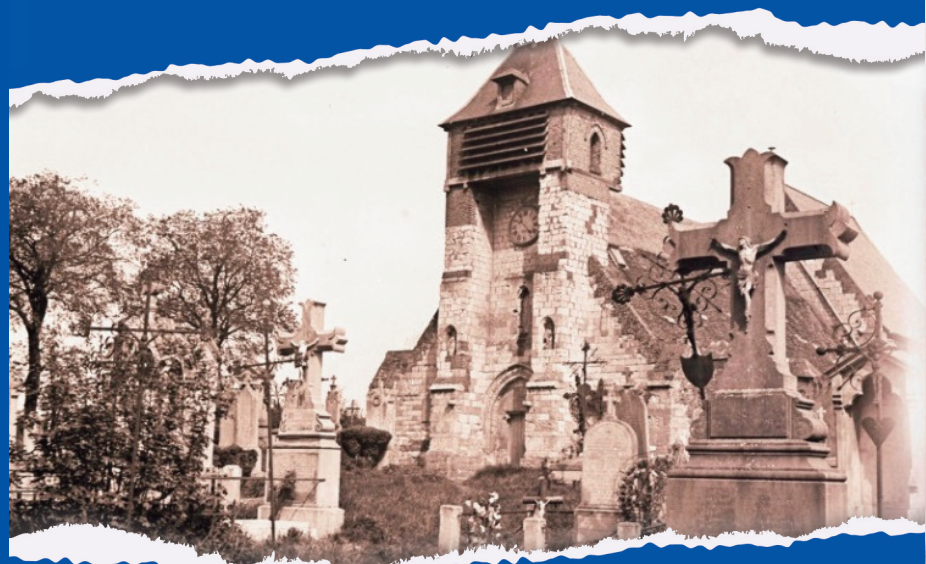
Vue de l'église et du cimetière de Vers-sur-Selle, plaque de verre, 1928, [12Z35]