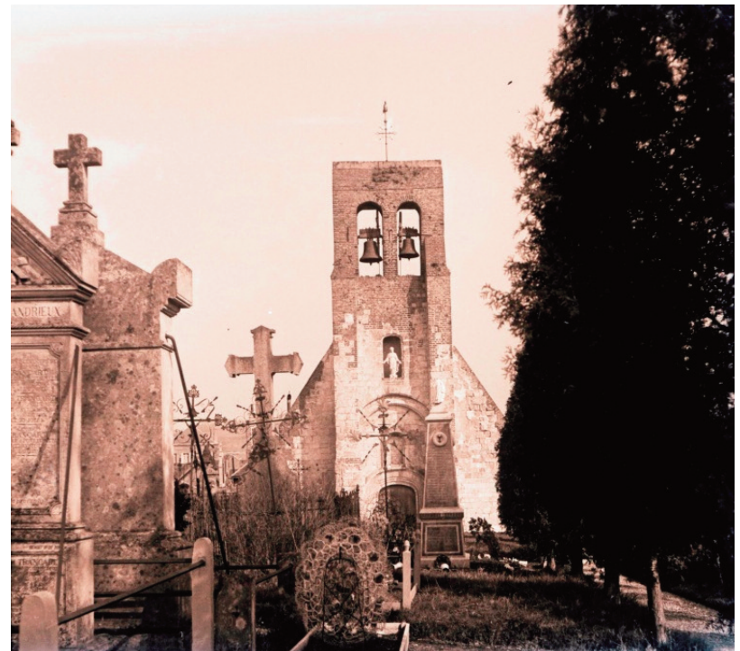
A : Monuments funéraires de Frédéric Petit et de Jules Barni au cimetière de la Madeleine Amiens, carte postale, s.d.