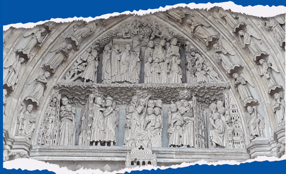
Détail du portail Saint-Firmin de la cathédrale Notre-Dame d'Amiens : invention et translation des reliques de saint Firmin, photographie, novembre 2019