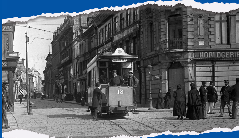
Passage du tramway rue des Trois-Cailloux et place Gambetta, à Amiens, photographie, 13 mars 1905.