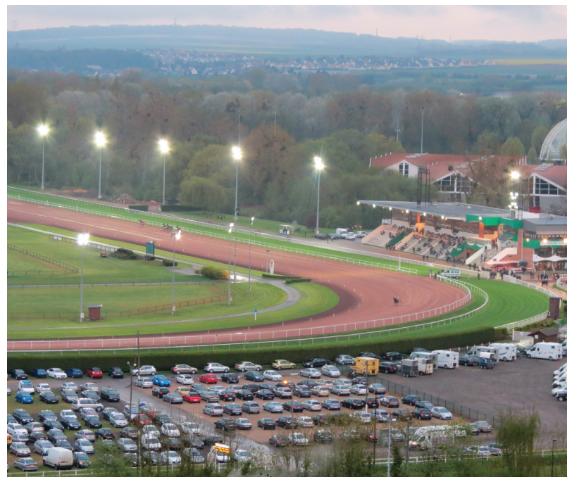
A : Hippodrome du Petit Saint-Jean d'Amiens, plan, s.d., [19Fi519, Archives municipales d'Amiens]