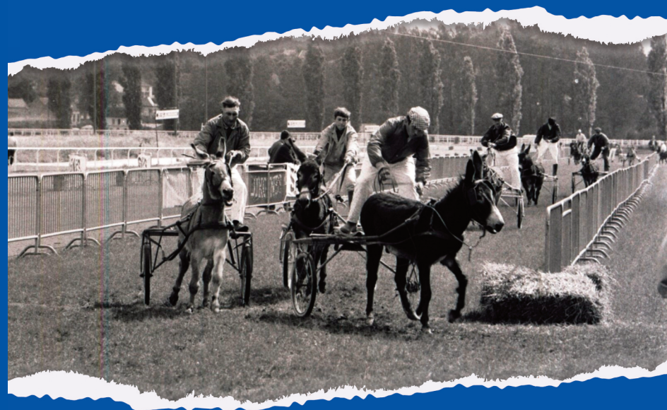
Course de sulkies avec des ânes à l’hippodrome du Petit Saint-Jean à Amiens, organisée à l’occasion de l’arrivée de l’étape Rouen-Amiens du Tour de France, photographie, 1 er juillet 1970, [25Fi2945, Archives municipales d’Amiens]