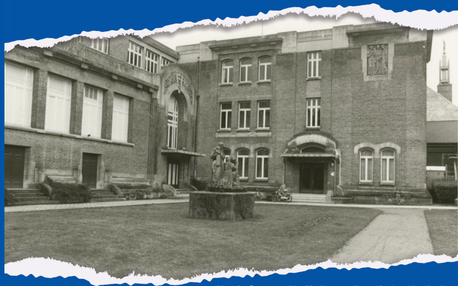
Vue du Conservatoire d'Amiens, ancienne école nationale de Musique et d'Art dramatique d'Amiens, photographie, vers 1970, [11Fi1066]