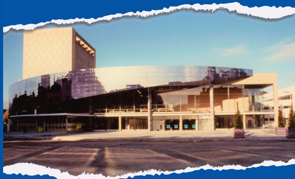
Photographie de la Maison de la Culture d'Amiens, 1996

La Maison de la Culture : derrière son parvis, l'autre cathédrale d'Amiens