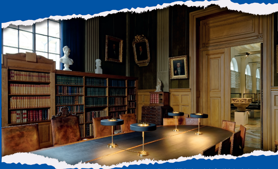
La salle des délibérations de la Société des Antiquaires de Picardie

ar chi ves cycle de conférences Saison 2023-2024 les Archives se racontent