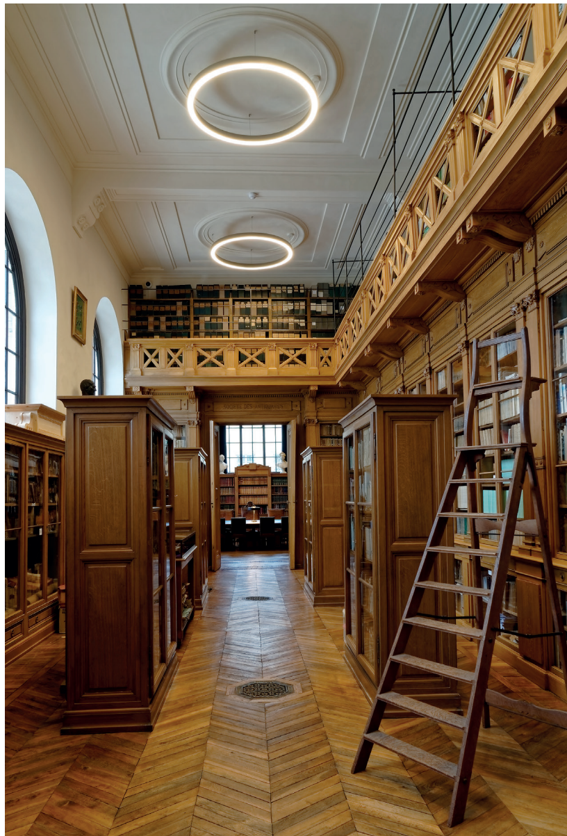
La bibliothèque de la Société des Antiquaires de Picardie