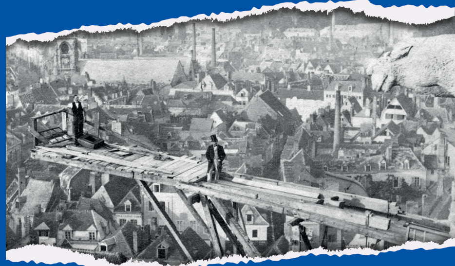
Échafaudage à bascule installé sur la façade occidentale de la cathédrale, Archives municipales et communautaires d'Amiens Métropole, 1023957