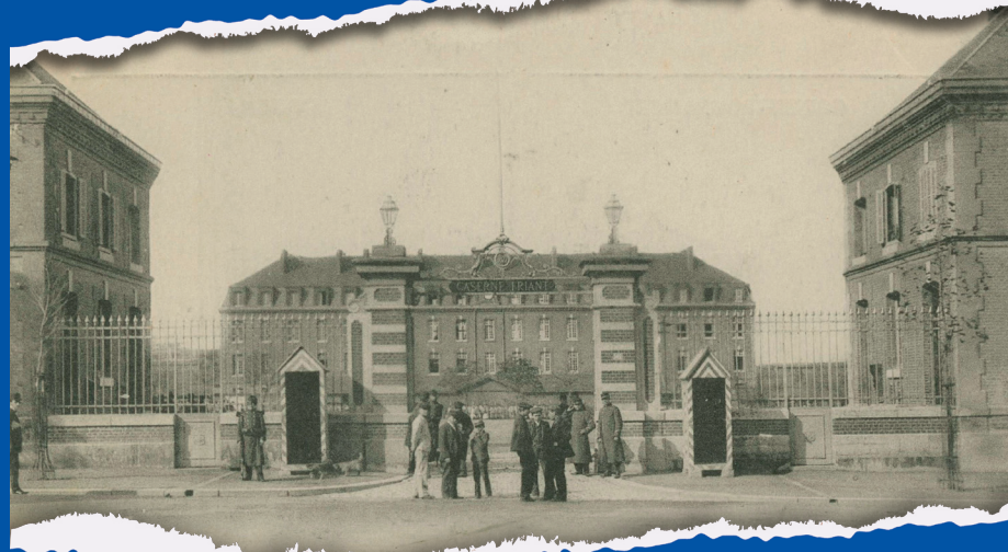
Carte postale de la caserne Friant, début du XX e siècle Archives municipales et communautaires d'Amiens, 10Z3407, fonds Maurice Duvanel