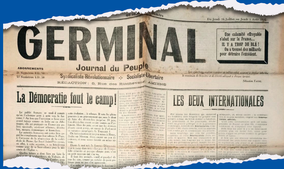
Journal Germinal, 1938