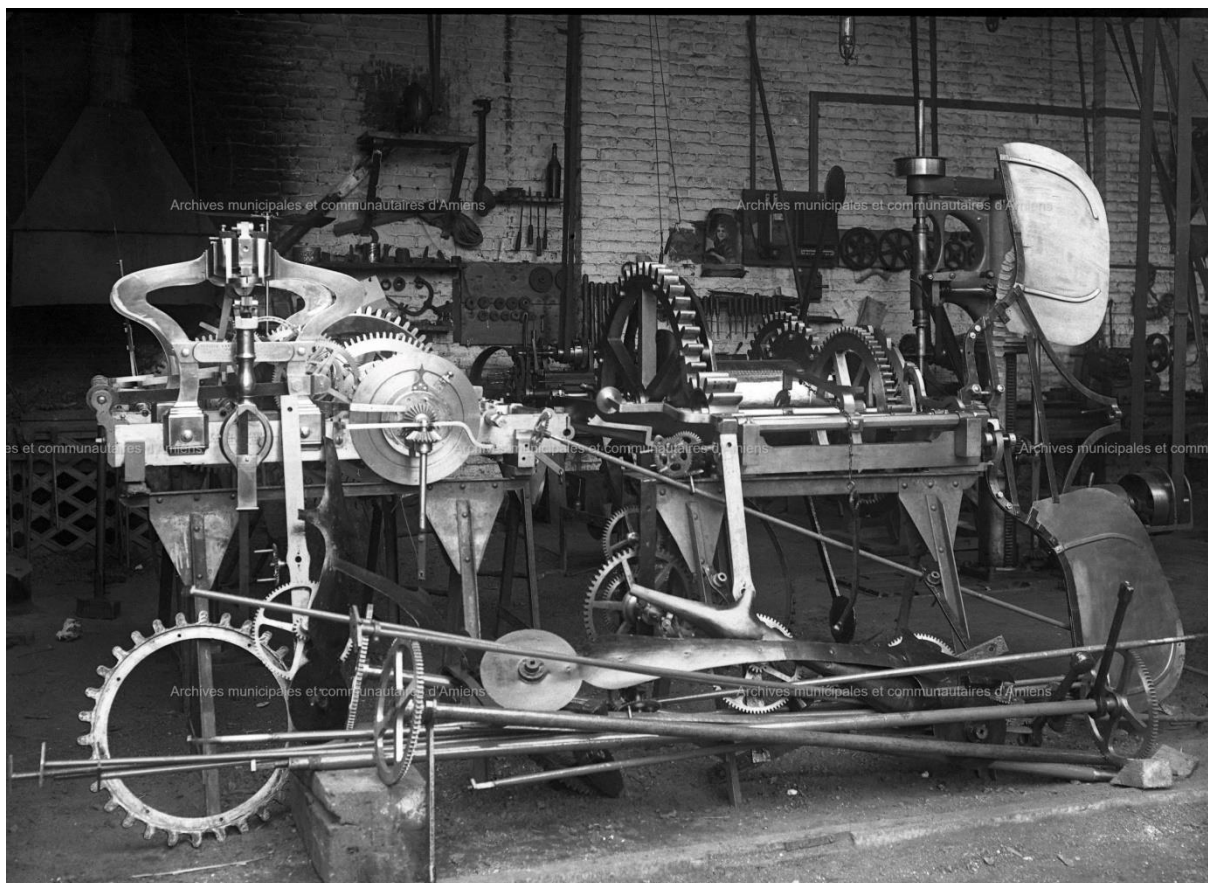
10Z3121 Le mécanisme de l'horloge du Beffroi à l'atelier de forge, première moitié du XXe siècle, sd