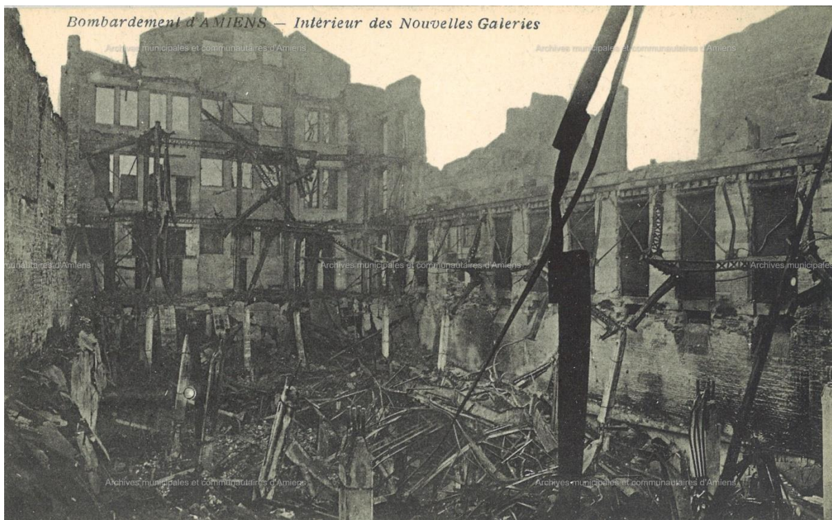
11Z374, Archives municipales et communautaires d'Amiens. Intérieur des Nouvelles Galeries d'Amiens après les bombardements de la Première Guerre mondiale, carte postale, sd (Don Maurice Duvanel)