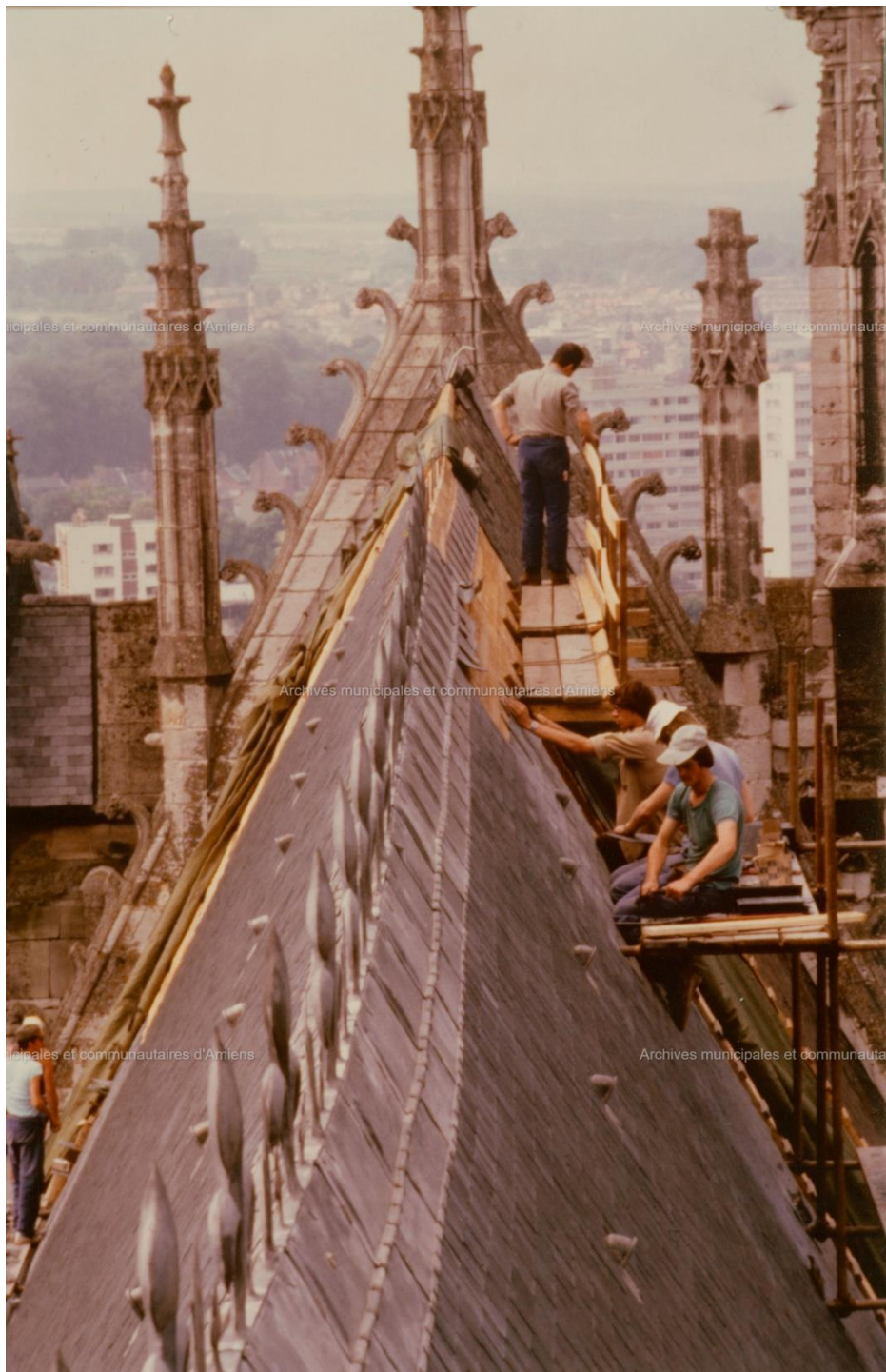
112875, Archives municipales et communautaires d'Amiens. Chantier de restauration de la Cathédrale Notre-Dame d'Amiens, sd (Don Maurice Duvanel)