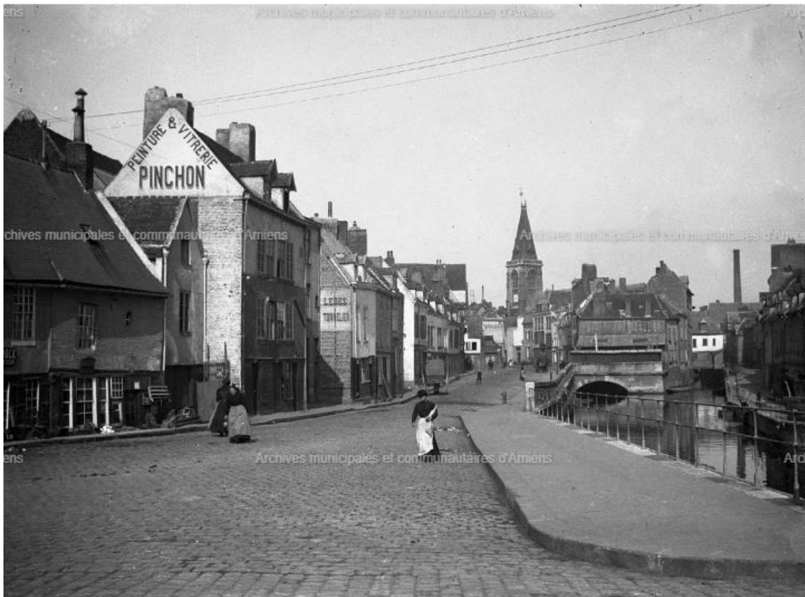
1023667, Archives municipales et communautaires d'Amiens. Rue des Majots, quartier St-Leu, 2009 (Don Maurice Duvanel)