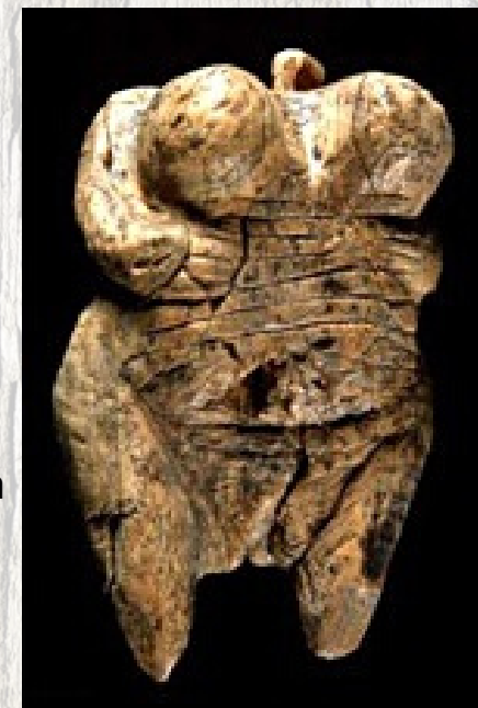
2-Vénus de Hohle Fels, Allemagne, ivoire de mammouth.