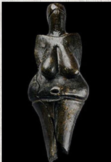
1-Vénus de Dolni Vestonice, République Tchèque, argile.

Au Paléolithique récent les Homo sapiens, la même espèce que nous, ont réalisé de nombreuses statuettes de femmes présentant, la plupart du temps, des hanches et fesses larges et une poitrine développée. Elles sont sculptées en matière dure animale (ivoire de mammouth, os), en pierre ou plus rarement en argile.