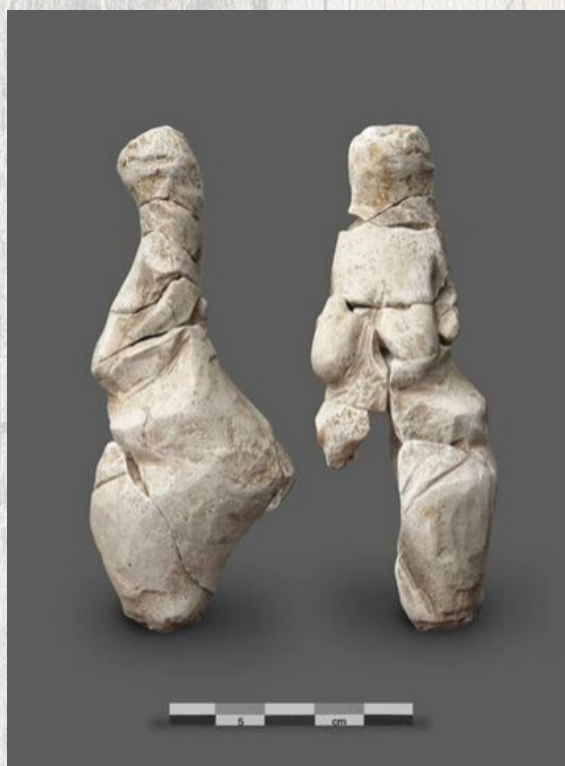
3-Vénus de Renancourt, Amiens, France, craie.