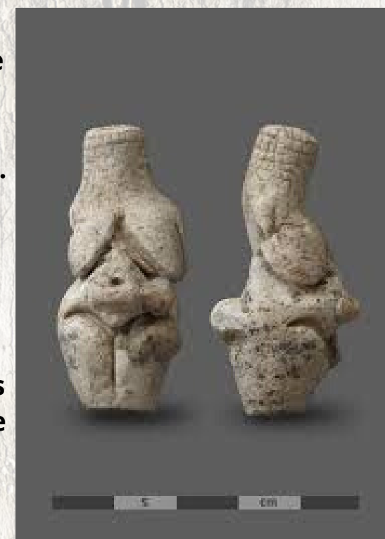
4-Vénus de Renancourt, Amiens, France, craie.

La seconde (4) mesurant 4 cm, se caractérise par ses détails et en particulier les quadrillages réalisés sur sa tête pouvant représenter des cheveux ou une coiffe. Elle est visible au musée de Picardie. Elles sont datées de la période gravettienne il y a environ -23 000 ans.