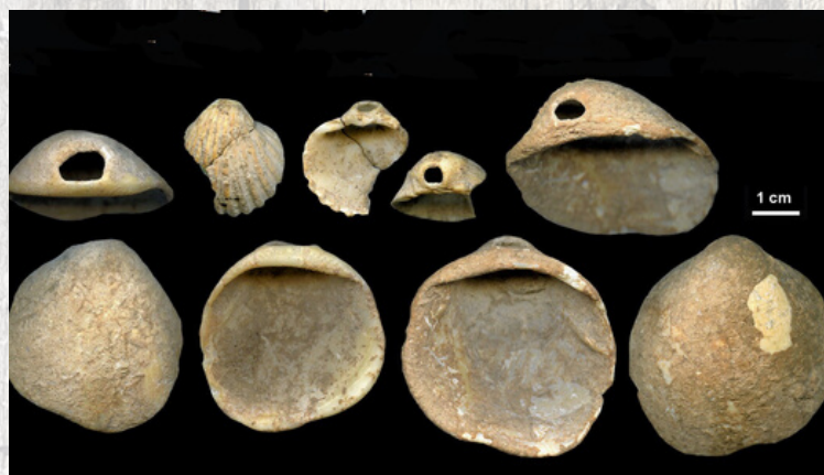
1-Coquillages percés, Espagne, Dirk Hoffmann, Science Advances ©.