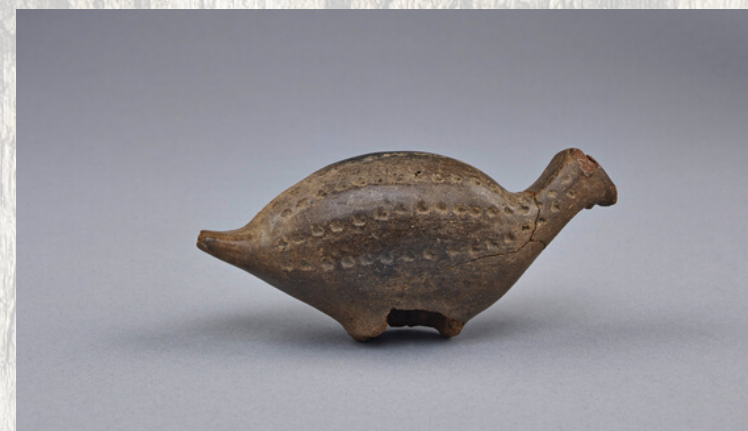
3-Sifflet en forme d'oiseau en argile, Tigy, France, Musée d'Archéologie Nationale - V. Gô©.