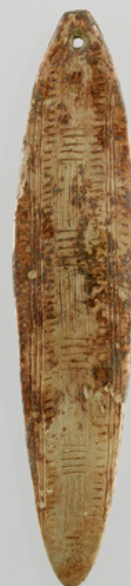
2- Rhombe en bois de renne, France, RMN-Grand Palais, Musée d'Archéologie Nationale©.