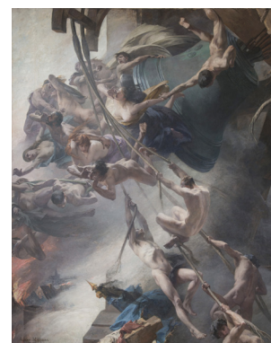
Les Voix du tocsin, Albert MAIGNAN, 1888