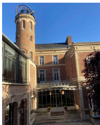
Vue de la Maison de Jules Verne