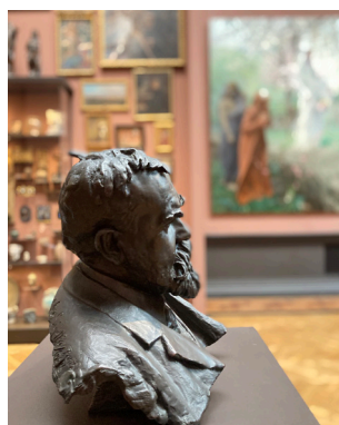
Vue de l'atelier Albert Maignan