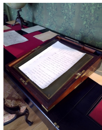
L'écrivain de Jules Verne