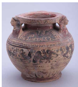
Boîte à toilette, Céramique, argile cuite, provenance : Corinthe, 1 er quart du VI e siècle av. J.-C.