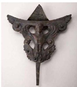
Attache de miroir, provenance : Égine, Décor de sirène aux longs cheveux, première moitié du V e siècle av. J.-C.