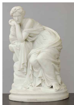
Calypso, marbre, Célestin-Anatole Calmels, 1853