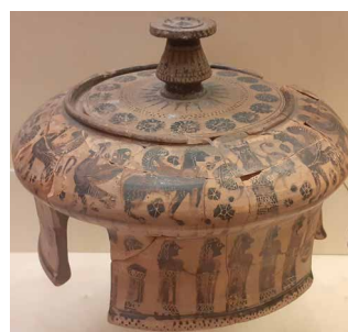
PYXIS tripode, Céramique attique, peintre du Polos. Athènes, vers 560 avant J.-C., Décor : sirène, sphinx. Décor sur pieds : ronde de femmes, musicienne jouant de la lyre.