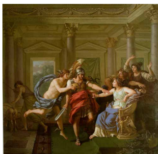
Ulysse arrivant dans le palais de Circé, Jean-Jacques Lagrenée, 1787