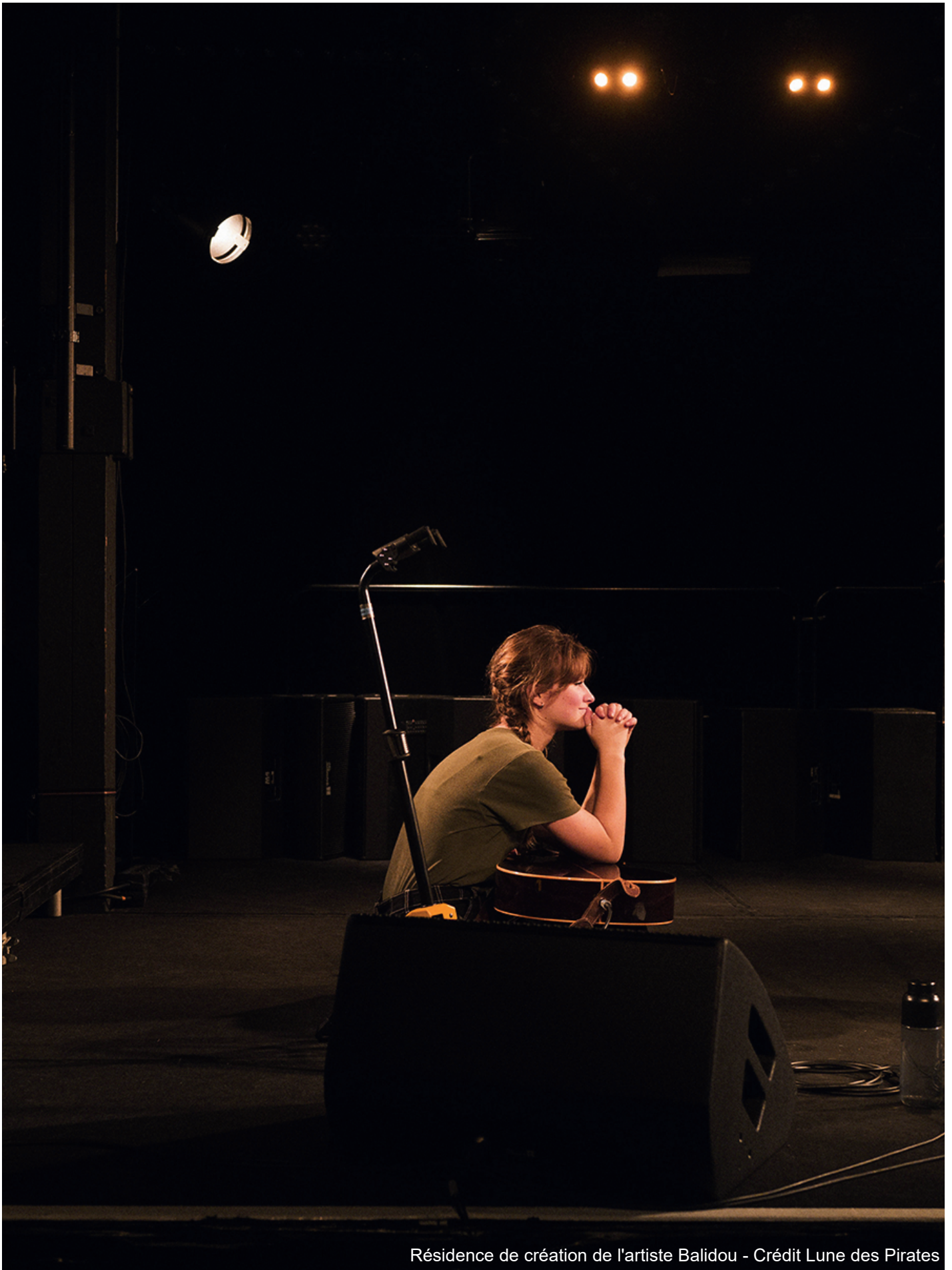
Résidence de création de l'artiste Balidou