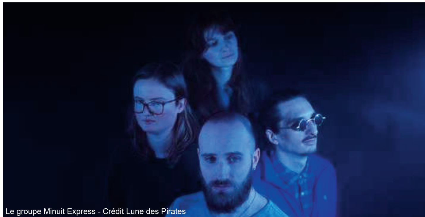
Le groupe Minuit Express

\\ Accentuer la présence d'artistes locaux dans les espaces de diffusion