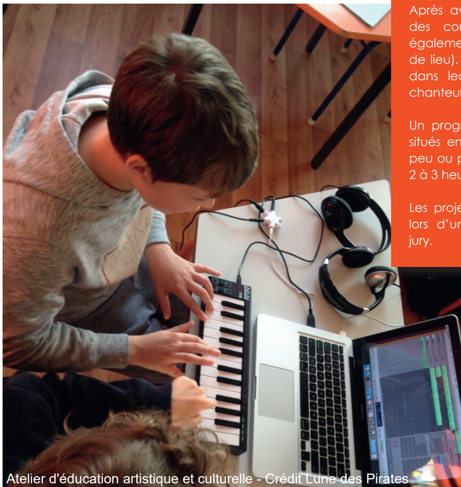
Atelier d'éducation artistique et culturelle

Les projets aboutis sont valorisés par leur diffusion lors d'une cérémonie officielle avec votes d'un jury.