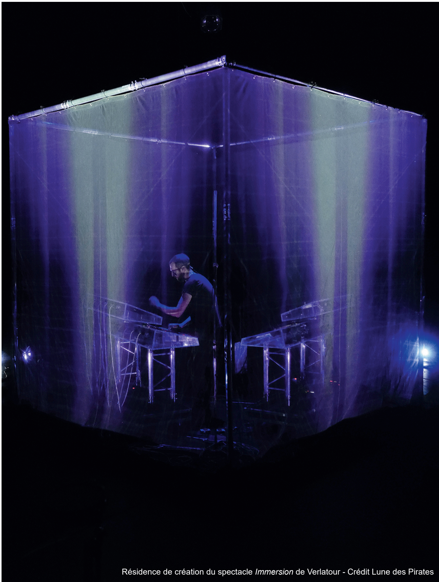
Résidence de création du spectacle Immersion de Verlatour