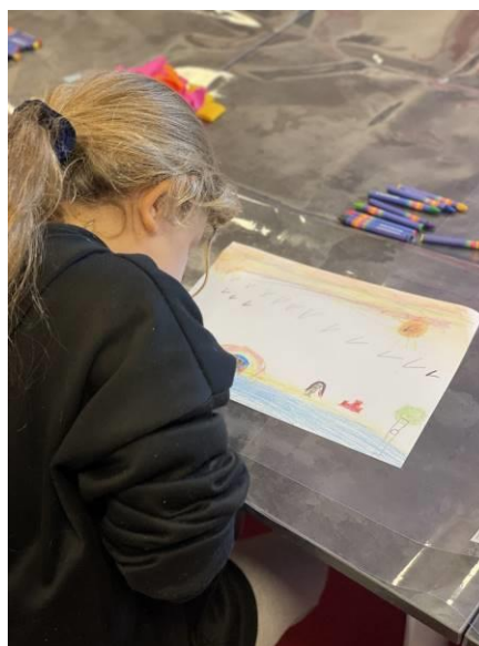
Atelier "Mon paysage idéal"