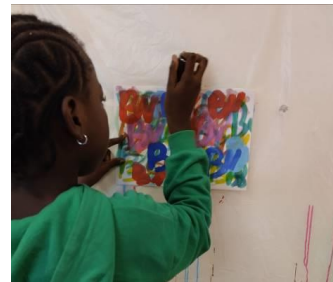
Atelier « L'accumulation de Tag »