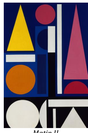
Matin II , Auguste Herbin