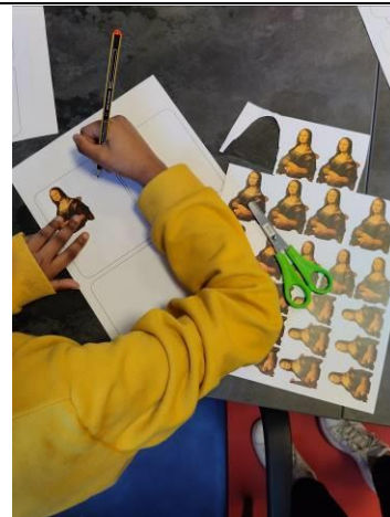
Atelier "Crée ta bande dessinée"