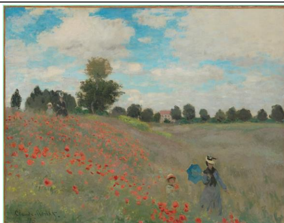
Coquelicot, Claude Monet