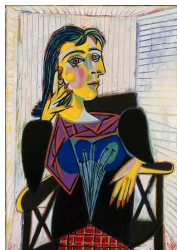
Portrait de Dora Maar, Pablo Picasso