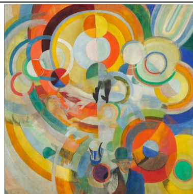
Le manège de cochons, Robert Delaunay

Cette thématique est également l'occasion de parler de ses émotions face à une œuvre d'art.