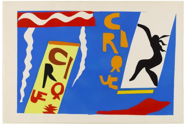
Le Cirque, Henri Matisse