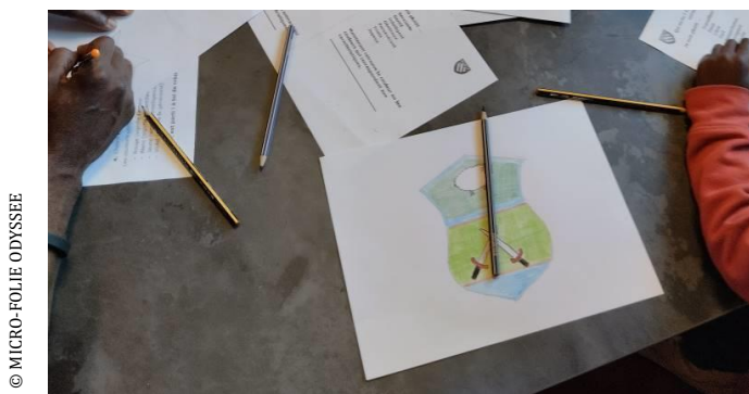
Atelier " Créer ton blason"

Après avoir découvert le blason des rois de France, les participants pourront créer leur propre blason en fonction de leur personnalité et de leur caractère.