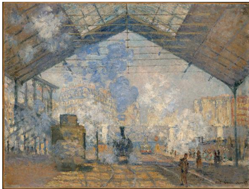
La Gare Saint-Lazare, Claude Monet