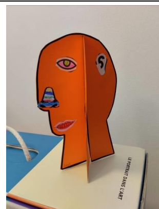
Atelier « Création d'un portrait cubiste »

Eléments essentiels de l'histoire de l'art depuis l'Antiquité, les portraits ont connu une évolution considérable dans leur constitution (gravure, sculptures, peintures, photographie...). Aux portraits, s'ajoutent les autoportraits où les artistes vont s'interroger sur leur propre représentation. Ainsi, le musée numérique permettra aux participants de découvrir ce genre pictural