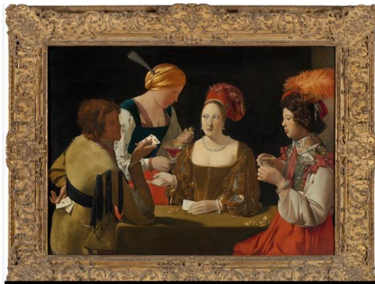
Le tricheur à l'As de carreau, Georges de la Tour