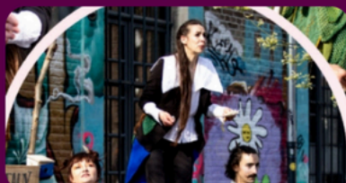
Compagnie Bécots les Cœurs La créée aux oiseaux