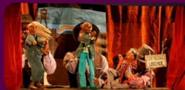
Compagnie Elika Oulala