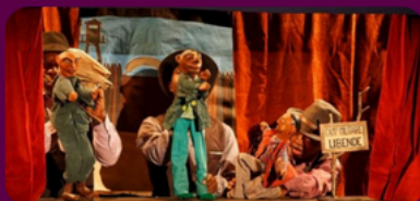
Compagnie Elika Oulala