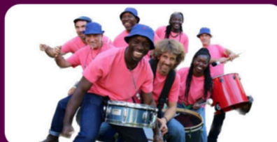
Compagnie Elika Katape