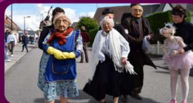
Compagnie Les Invisibles Les hybrides