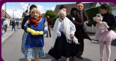
Compagnie Les Invisibles Les hybrides