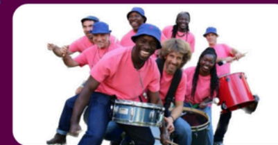
Compagnie Elika Katape