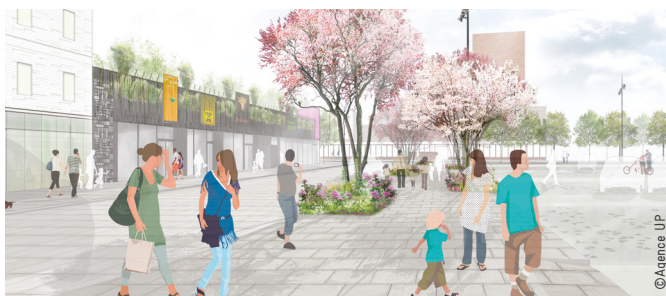
Requalification complète des espaces publics du Colvert