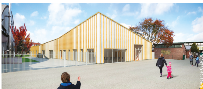
Construction d'un nouveau centre social en coeur de quartier