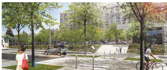
Des espaces publics apaisés