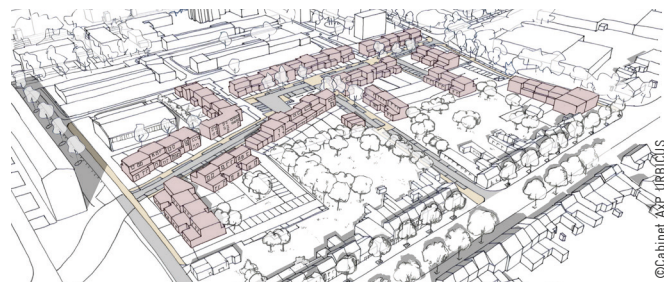
Un nouveau quartier d'habitat sur l'ancien Village des écoles