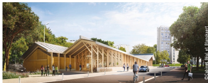
Une médiathèque bioclimatique visible et accessible pour tous