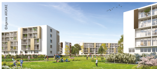
Réhabilitation de 830 logements à Marivaux