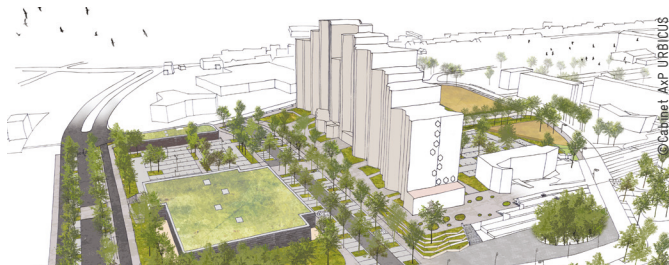
Une centralité retrouvée sur l'îlot des Coursives