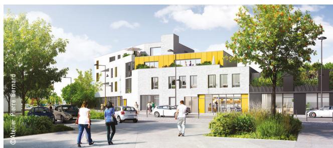
Construction de logements en accession à la propriété place du Colvert