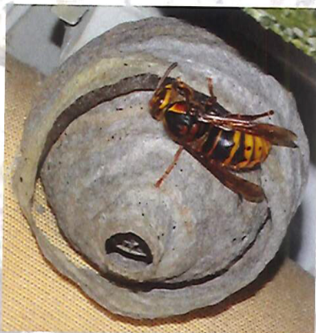
Nid primaire de frelon européen

Le nid primaire du frelon asiatique héberge 20 à 30 insectes. Il est généralement construit dans un endroit abrité à hauteur d'homme (ruche vide, cabanon, trou de mur, bord de toit, roncier...). L'orifice de sortie est situé à la base.