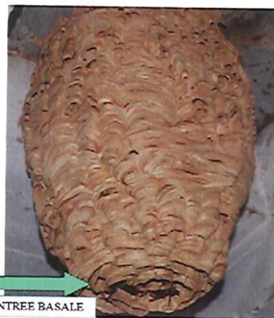
Nid secondaire – frelon européen

Le nid secondaire du frelon asiatique, qui héberge 2000 à 3000 individus, est délocalisé du nid primaire dans 70% des cas, si l'environnement devient défavorable ou l'emplacement trop étroit pour la colonie en croissance. Généralement il se situe à plus de 10, 15 mètres de haut dans un grand arbre, mais des cas particuliers sont à noter (bâtiments, haies,...). L'orifice de sortie est petit et situé latéralement sur le nid.