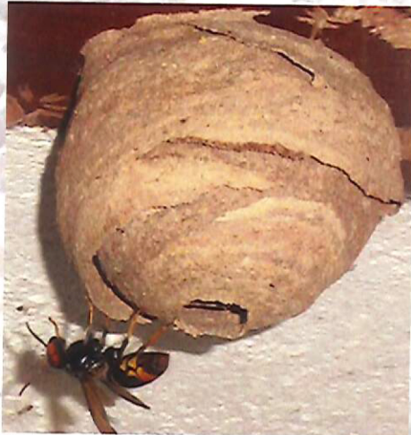
Nid primaire de frelon asiatique

Le nid primaire du frelon asiatique héberge 20 à 30 insectes. Il est généralement construit dans un endroit abrité à hauteur d'homme (ruche vide, cabanon, trou de mur, bord de toit, roncier...). L'orifice de sortie est situé à la base.