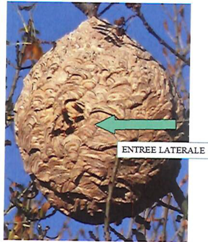
Nid secondaire – frelon asiatique

Le nid secondaire du frelon asiatique, qui héberge 2000 à 3000 individus, est délocalisé du nid primaire dans 70% des cas, si l'environnement devient défavorable ou l'emplacement trop étroit pour la colonie en croissance. Généralement il se situe à plus de 10, 15 mètres de haut dans un grand arbre, mais des cas particuliers sont à noter (bâtiments, haies,...). L'orifice de sortie est petit et situé latéralement sur le nid.